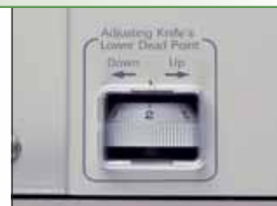
切纸深度调整圆盘