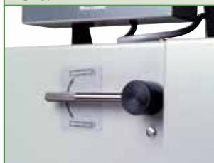
切刀角度调整手柄