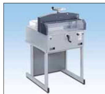
PC-45SC压切纸机 切纸宽度：44.6厘米 (17.5英寸)

NIPPON BINDING EQUIPMENT LTD. 日本釘裝器材有限公司