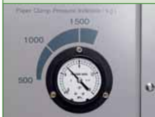
压纸器压力指示器