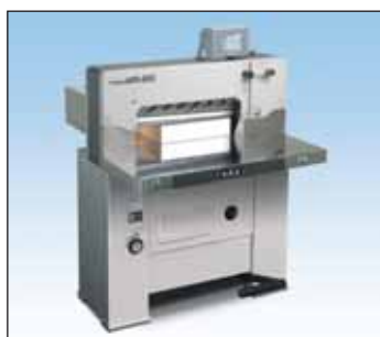
APC-61II程控式液压切纸机 切纸宽度：61厘米 (24.0英寸)