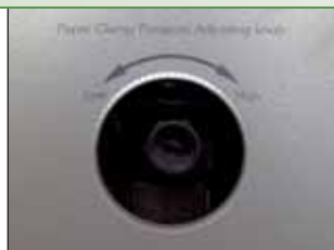
压纸器压力调整旋钮