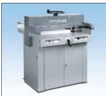
PC-64IISC压切纸机 切纸宽度：64厘米 (25.1英寸)