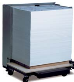
◀ 附件 (标配) (HOF-20 外置装纸装置)